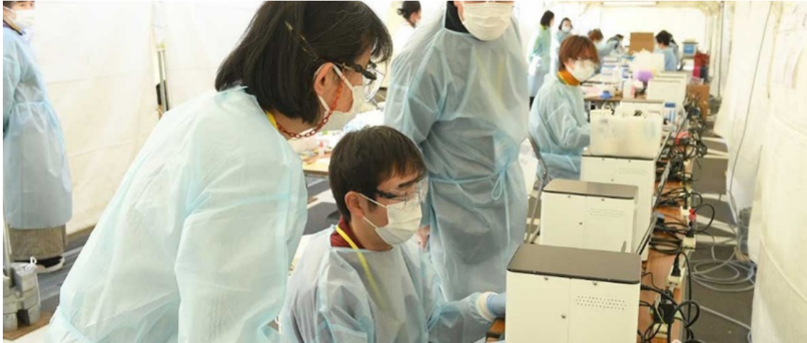
LEGENDでのオンサイト検査の様子

検査実績：チャリティボクシング「LEGEND」参加者約2500名（2021年2月11日@代々木体育館）、ほか各地スポーツ関連イベント。