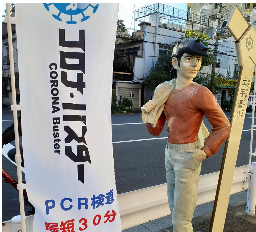
検査所の目印は「あしたのジョー」

（登録証） https://prtmes.jp/a/?f=d66892-20211108-5e4ddd2a882f23e27929c5a696df18dd.PDF